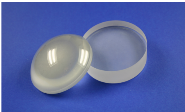
Abb. 1. Polierte Linsen

Ziel des Projekts ist die konventionellen Poliermittelträger in ihren Eigenschaften in Abhängigkeit des zu polierenden Glaswerkstoffes zu beschreiben, modellhaft abzubilden und weitere Einflussgrößen, die die Bildung des Flüssigkeitsfilms im Polierwirkspalt ausmachen in einem Kontaktmodell abzubilden. Dazu sollen die jeweiligen Kontaktverhältnisse (Reibzustände, Suspensionsfilmdicken) zwischen den Poliersystemkomponenten mit Hilfe eines Tribometers ermittelt werden. Auf Basis dieser Informationen soll ein Kontaktmodell erstellt werden, das zunächst mechanisch (Deformationsverhalten, Druckverteilung) aufgebaut ist und anschließend um weitere Größen wie fluiddynamische Einflüsse, Temperatureinfluss und Einfluss von Oberflächenenergien und funktionellen Gruppen erweitert wird.